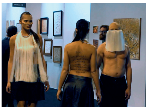
Performance Kraemer pour St'Art 2014

Après avoir participé à St'Art ( www.st-art.fr ) en novembre dernier en faisant déambuler, dans les allées de la 2 ème plus ancienne foire française d'art contemporain, des mannequins aux créations très contemporaines, le groupe Kraemer s'apprête à être partenaire de la 29 ème édition des Internationaux de Strasbourg du 15 au 23 mai 2015.